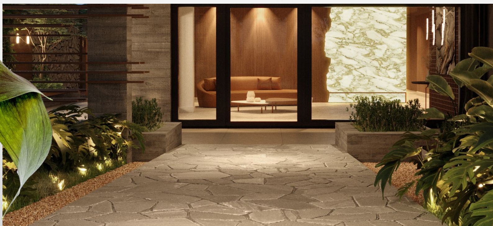
ESPLANADA DE ACESSO