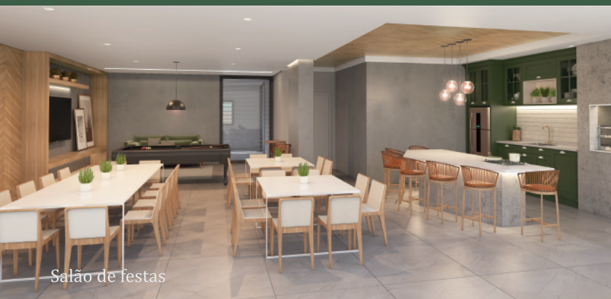
Salão de festas