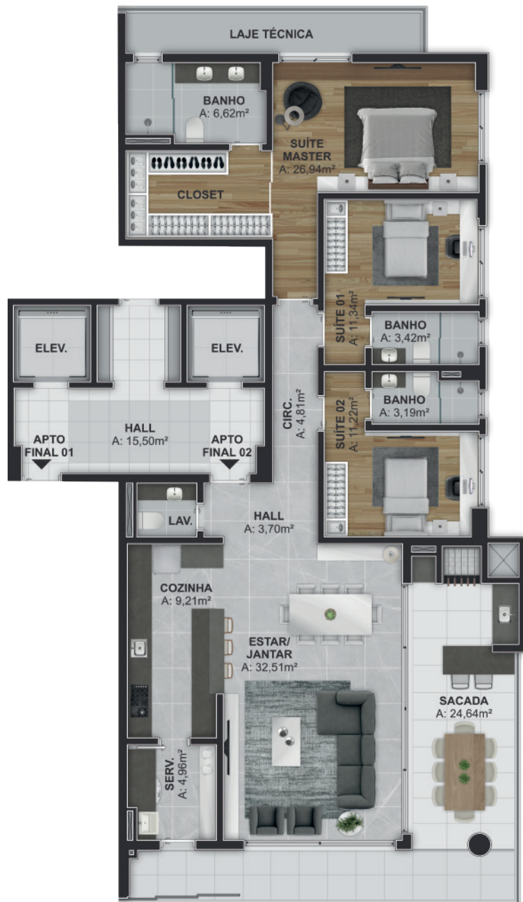
Planta-baixa referente às unidades finais 02