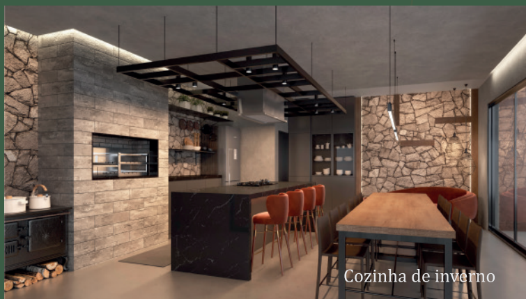
Cozinha de inverno