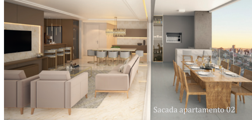
Sacada apartamento 02