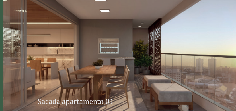
Sacada apartamento 01