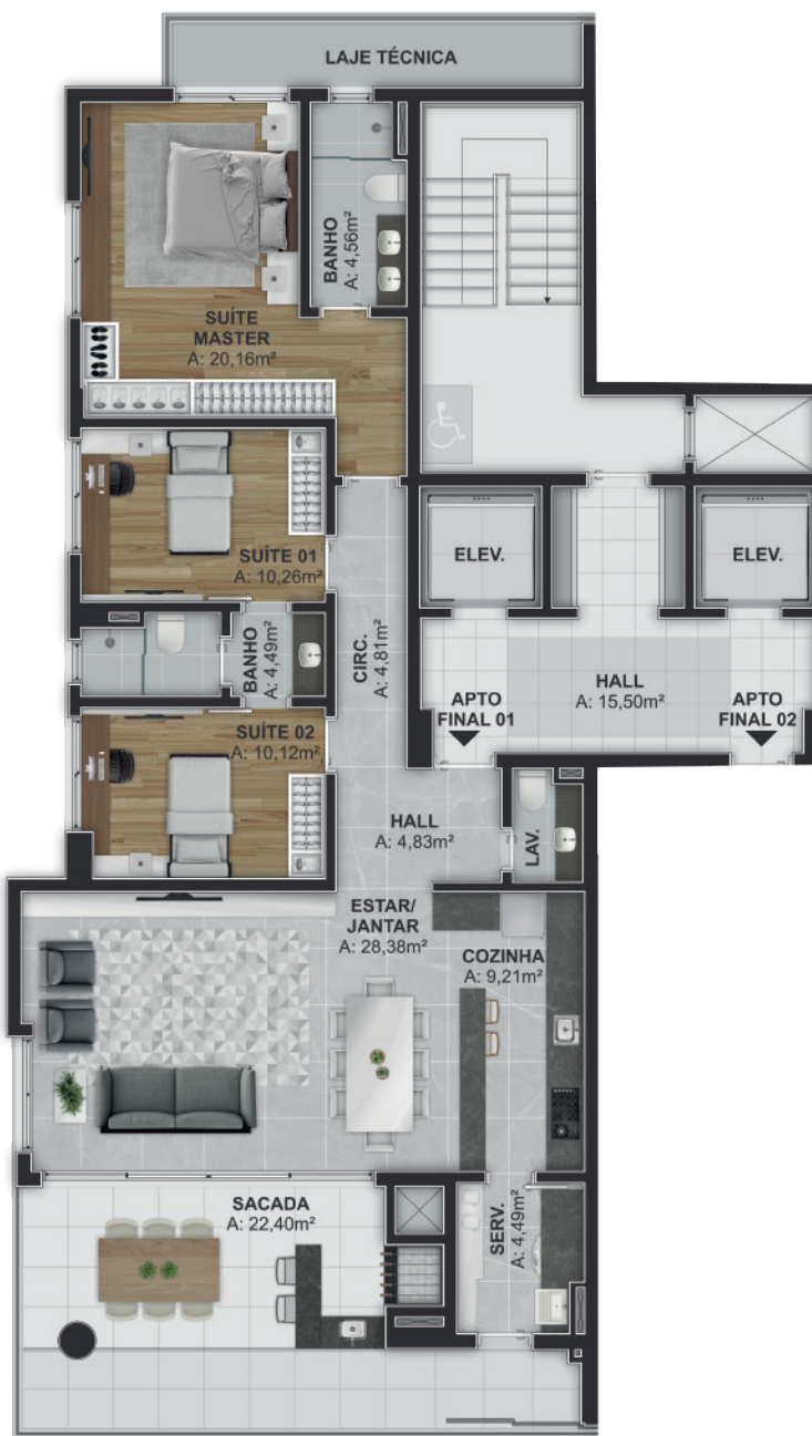
Planta-baixa referente às unidades finais 01